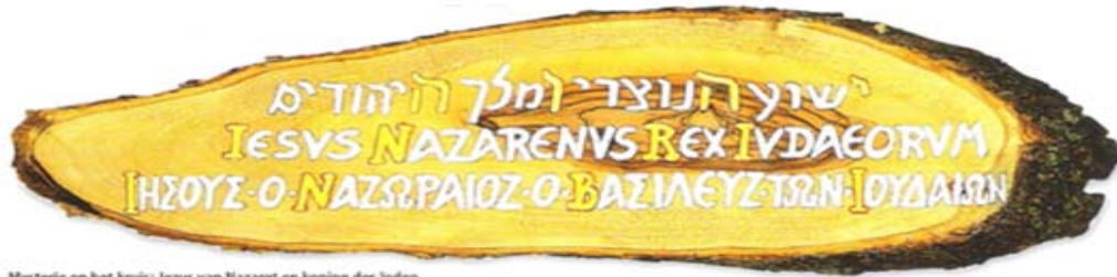
Mysterie op het kruis: Jezus van Nazaret en koning der Joden

‘Want het bloed is de levenskracht van een levend wezen’(Leviticus 17: 11) en ‘bloed is leven’ (Deut. 12:23). Als zodanig kan bloed van de aarde schreeuwen (Genesis 4:10, Openb. 6: 10), en kan het mensen in staat van beschuldiging stellen of juist verlossen.