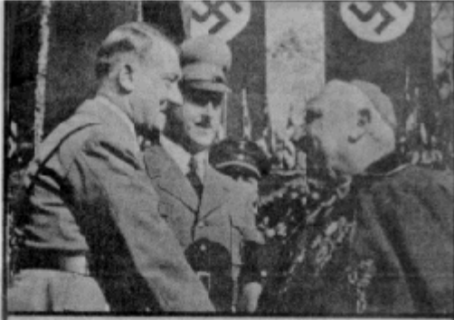
POSTER PROCLAIMING PAPIST-NAZI SOLIDARITY (Not widely seen outside of Germany)

IT'S A RELIGIOUS THING, YOU WOULDN'T UNDERSTAND.