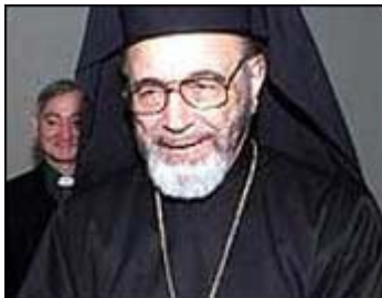
Archbishop Hilarion Capucci PLO arms smuggler and ardent Palestinian advocate.

De rol die Rome vandaag speelt ten aanzien van Israël is nog even bedenkelijk als vroeger. Zo bestaat er bewijsmateriaal dat Rome ‘Palestijnse’ terroristen de helpende hand heeft geboden. Israëlische Autoriteiten ontdekten dat de Rooms Katholieke aartsbisschop Hillarion Capucci, munitie en explosieven in zijn auto vervoerde, bestemd voor de PLO in Libanon, waarvoor hij door Israël is veroordeeld.